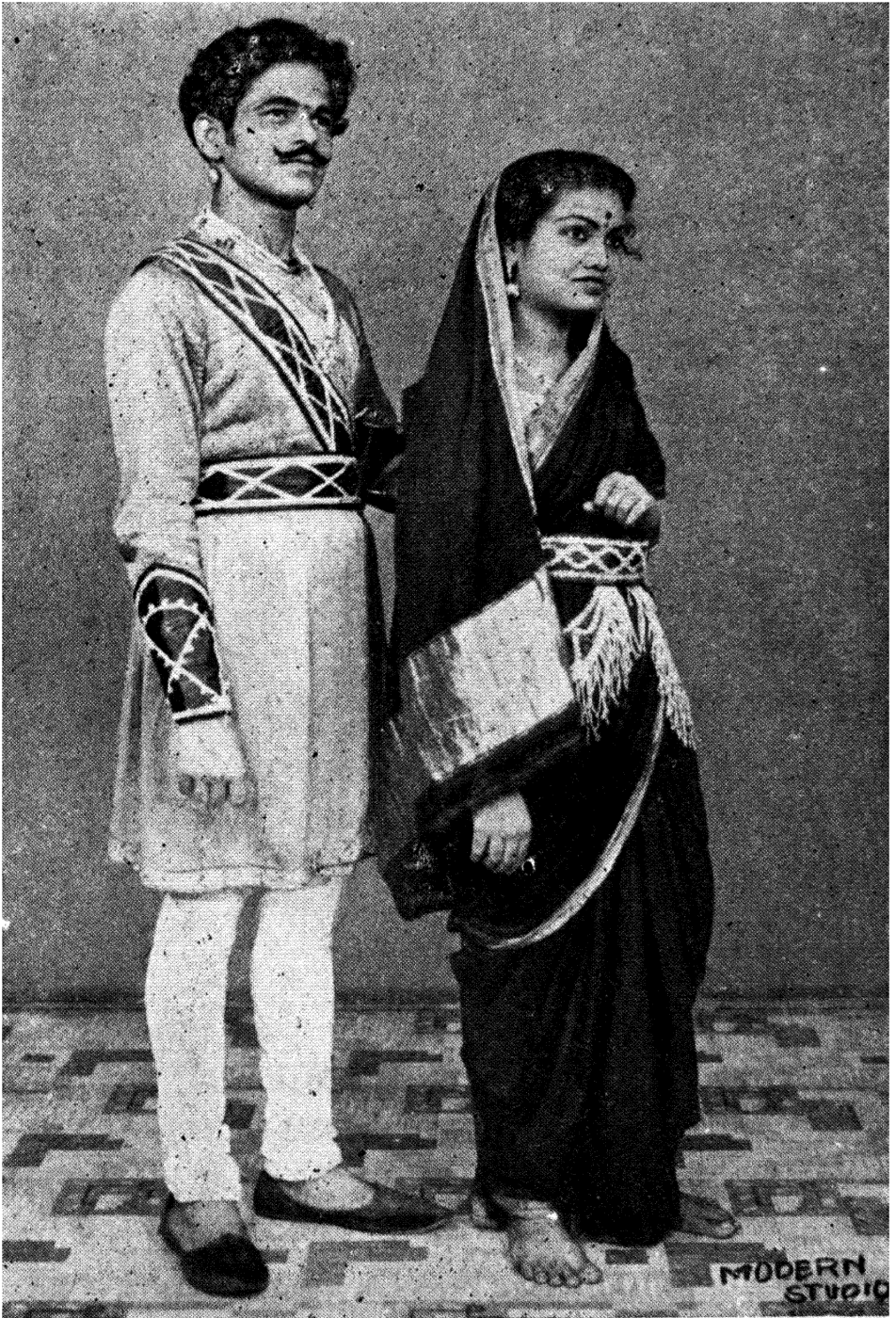
हंबीररावः—ती पाहिलीस कां संध्या—सुंदरी